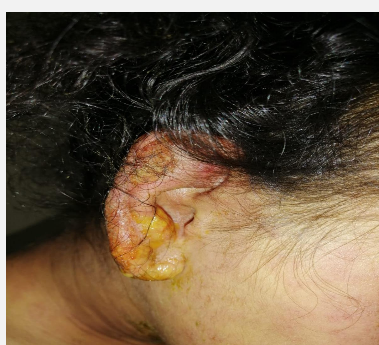
Lésion de lupus discoïde

Devant la surinfection des lésions cutanées une antibiothérapie fut prescrite à type d'amoxicilline acide clavulanique dès l'admission et une corticothérapie a été prescrite en IV le 2ème jour, l'évolution a été marquée par l'aggravation des lésions cutanées par l'apparition de nappes d'érythème confluent avec des décollements bulleux diffus déterminant un aspect en linge mouillé, un Nikolsky positif évoquant un syndrome de Lyell.