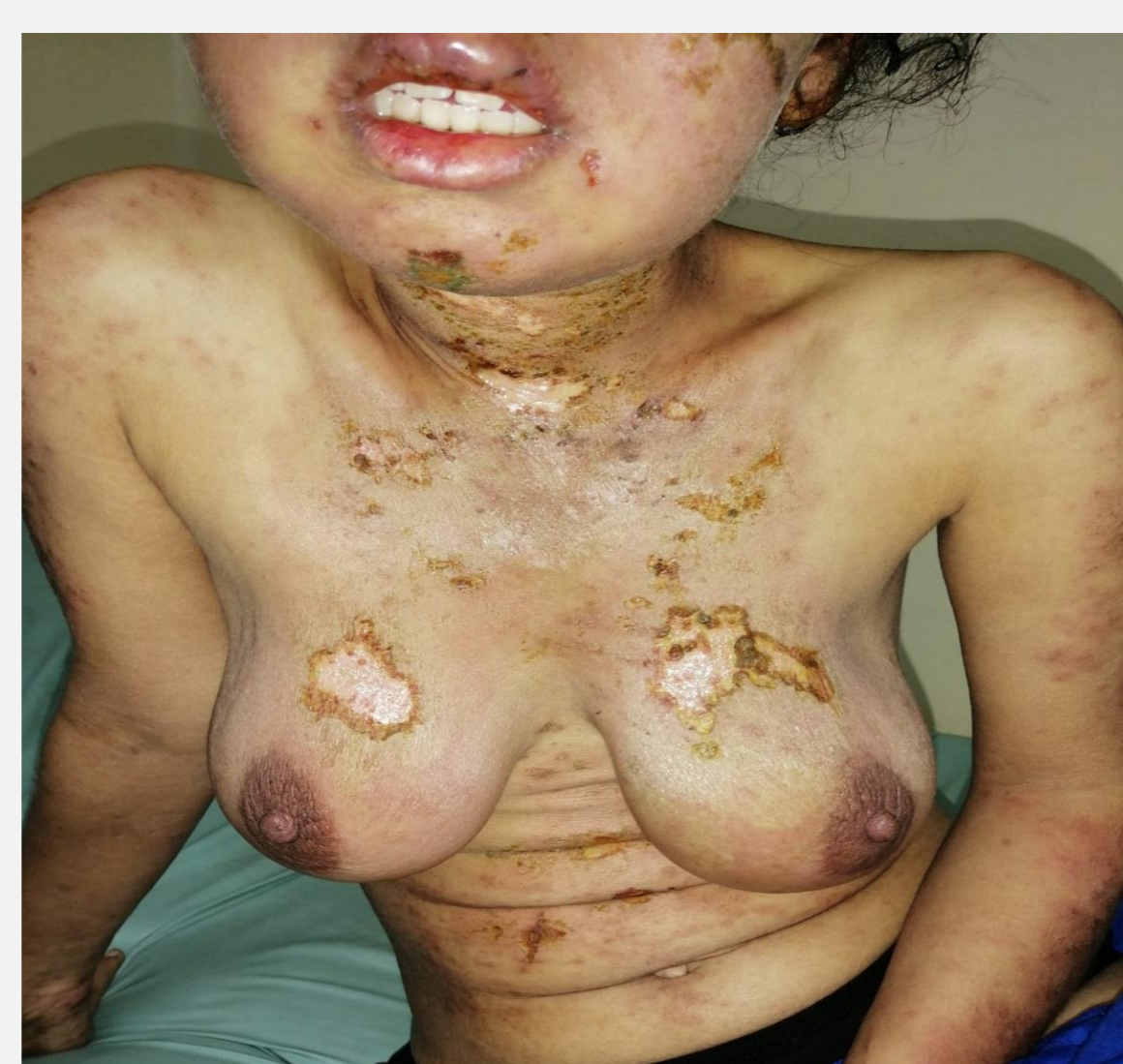
Ulcérations cutanées étendues