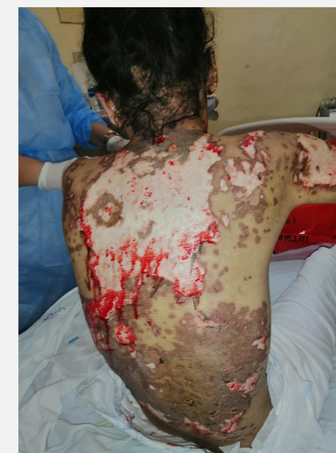
Nécrolyse épidermique toxique après administration d'antibiotique

L'enquête de pharmacovigilance avait incriminé l'antibiotique dans la survenue de cette nécrolyse épidermique toxique qui a été remplacé par la ciprofloxacine associée à des soins locaux tout en maintenant la corticothérapie. L'évolution était très défavorable ayant nécessité un transfert en réanimation devant la survenue d'un état de mal convulsif avec sur le plan biologique une dyskaliémie et cytolyse hépatique et un syndrome de détresse respiratoire. Le tableau s'est compliqué par le décès de la patiente 2 jours après son transfert en réanimation.